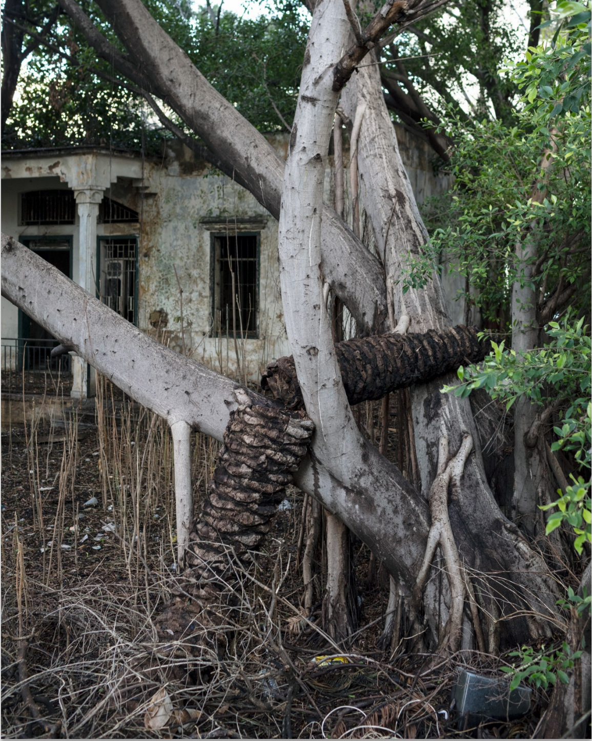
Ieva Saudargaitė Douaihi, From the Trees Before Last , ©Ieva Saudargaitė Douaihi