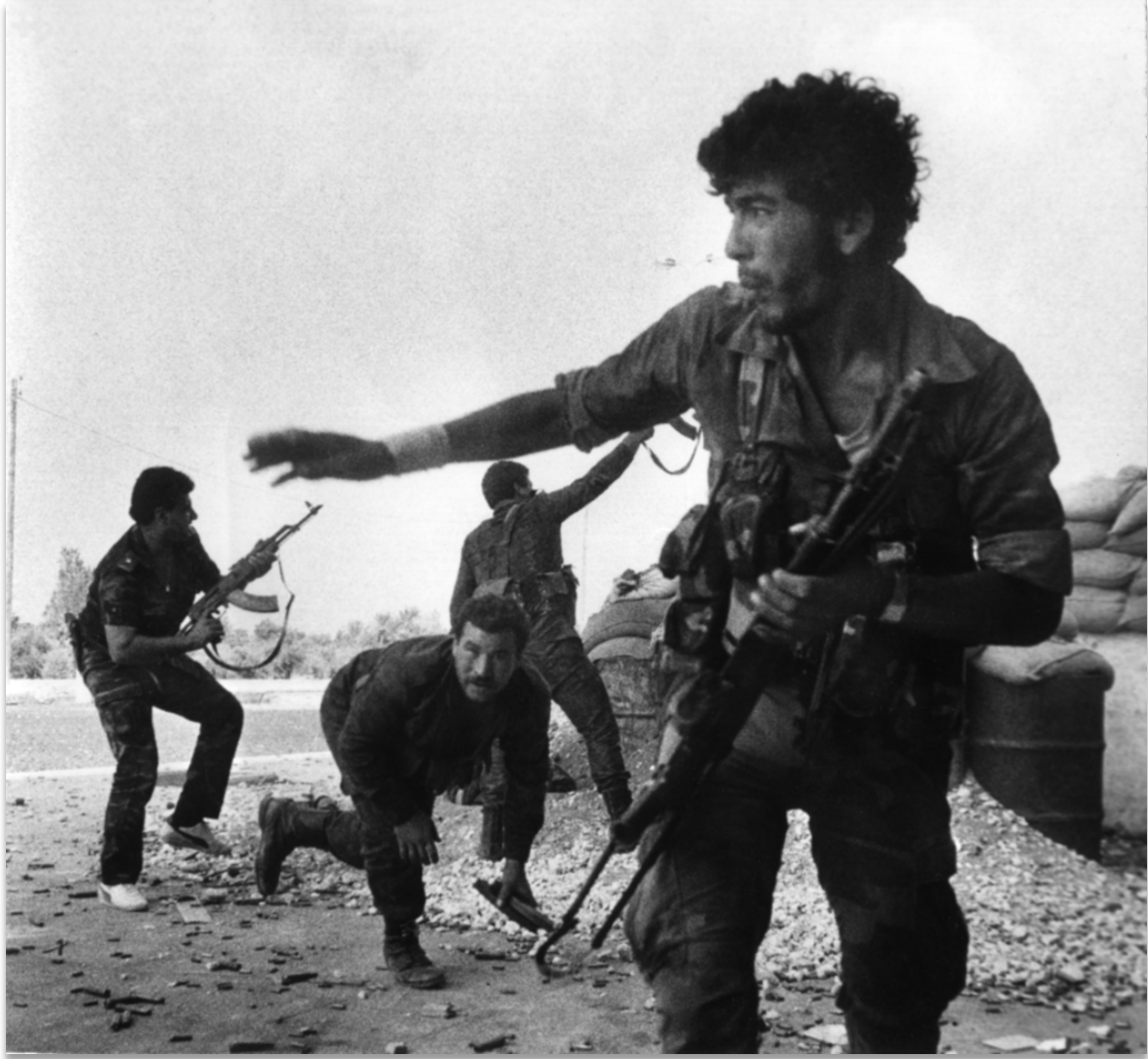
Aline Manoukian, Des combattants pro-Syriens pendant les batailles contre le groupe Islamiste Tawhid à Tripoli , Septembre 1985. ©Aline Manoukian.