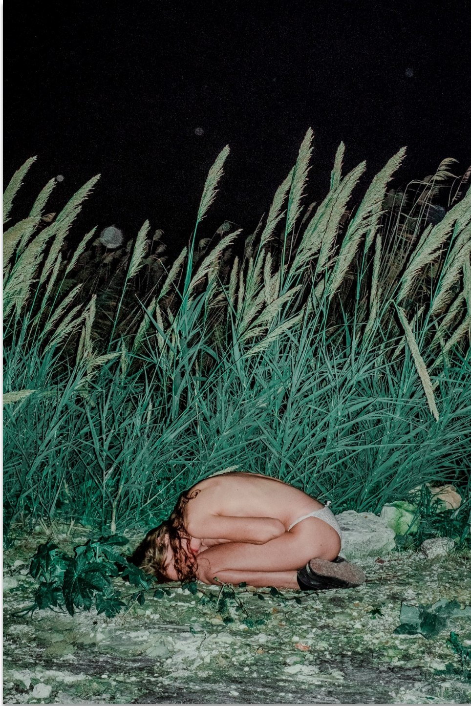
Myriam Boulos, Self-portrait , 2019. © Myriam Boulos.