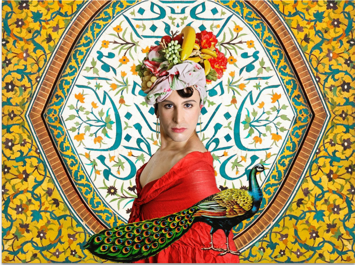
Chaza Charafeddine, Dame Aux Fruits , 2010, Background: calligraphy on a panel at the entrance of the Wazir Khan Mosque in Lahore, Pakistan. Photography, inkjet print on fine art paper, 43 x 32 cm. © Chaza Charafeddine