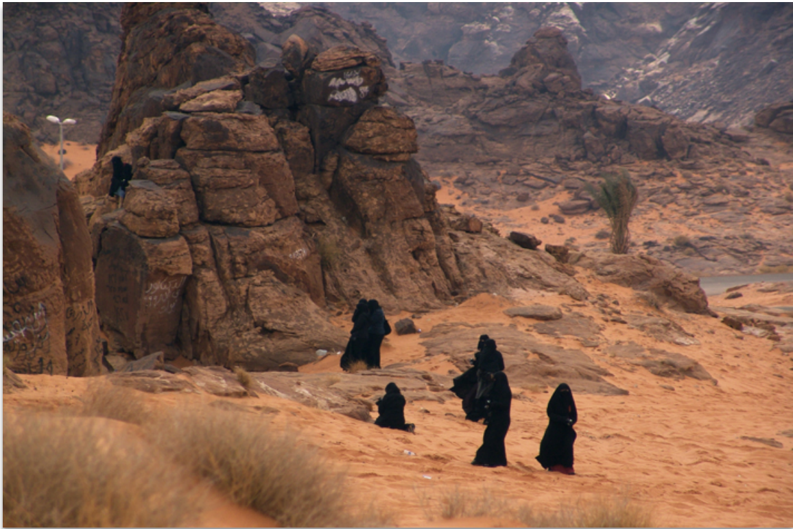
Danièle Chikhani, Hail VIII , 2008, photo print, 30 x 45 cm. ©Danièle Chikhani.