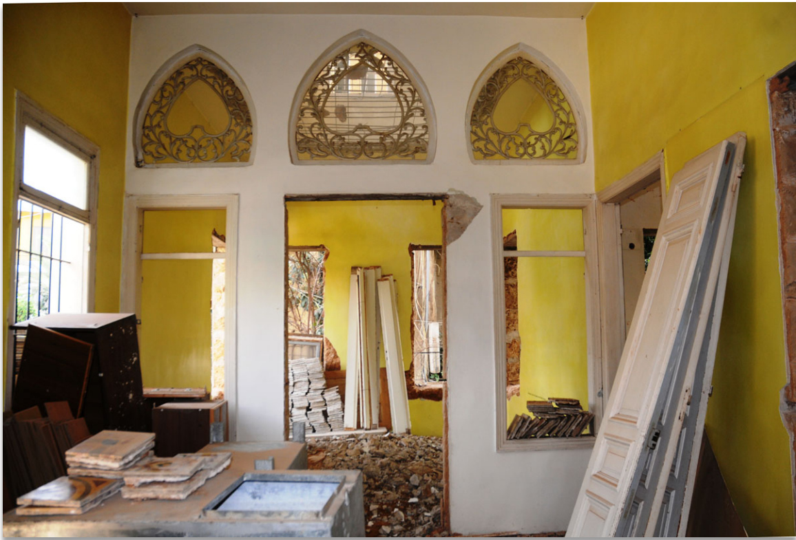
Houda Kassatly, Dévastation , 2009, photographie, 70 x 100 cm.