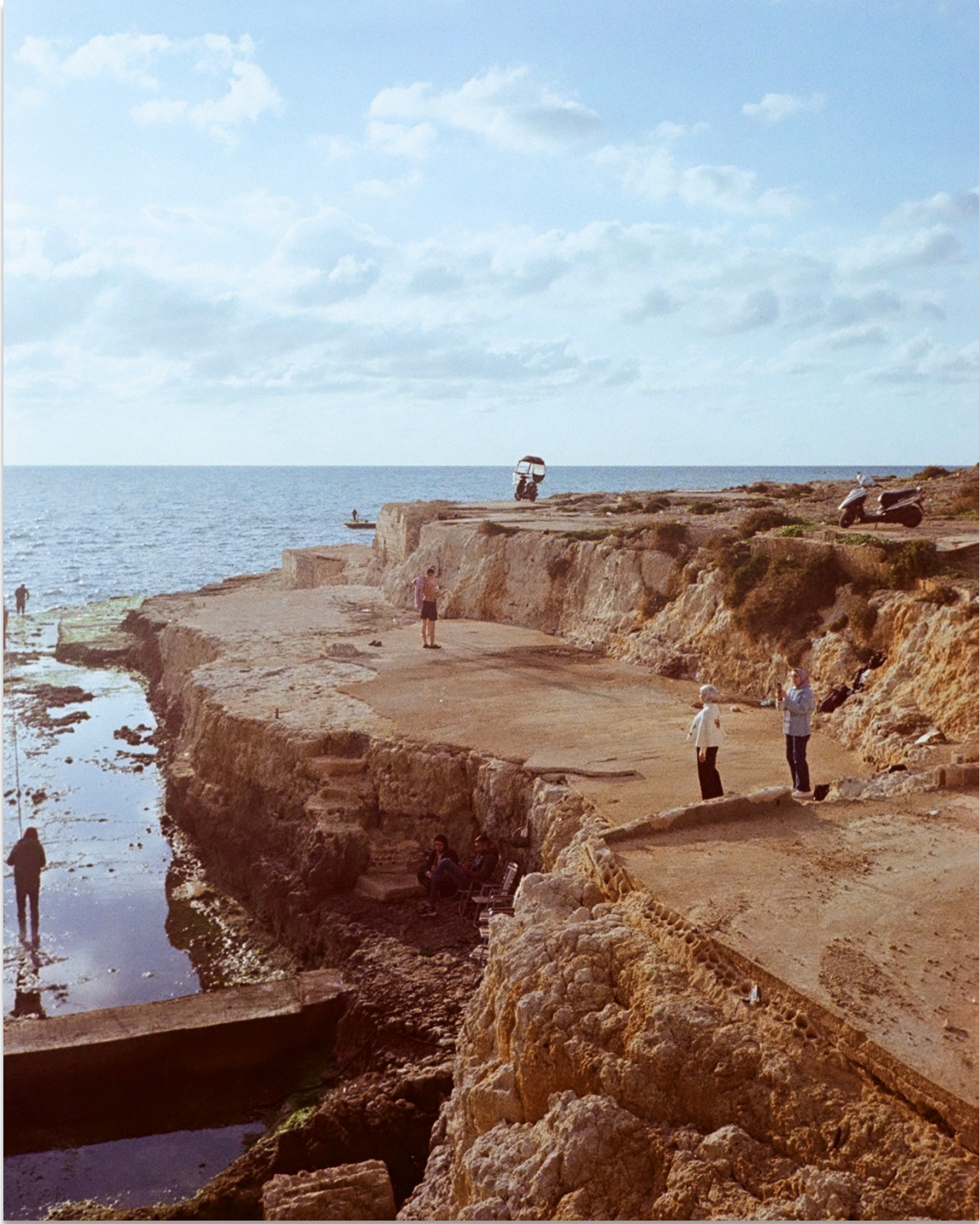
Tanya Traboulsi, From the series Beirut, Recurring Dream (2021-ongoing), © Tanya Traboulsi.